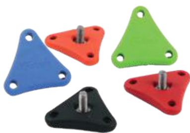
VITI A MANOPOLA