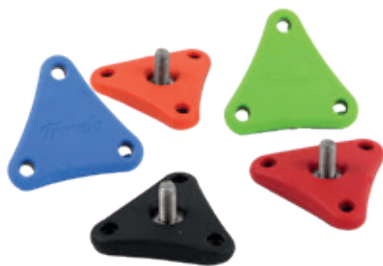
VITI A MANOPOLA